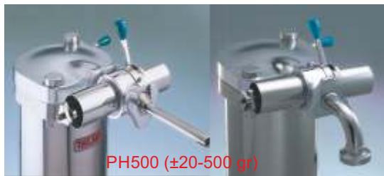
PH500 (±20-500 gr)

Wheels, pressure gauge, water resistant electrical unit. Rollen, Manometer, wasserdichter Schaltkasten. Roulettes, manomètre, boîtier électrique étanche. Wielen, manometer, waterdichte elektrodoos. Hjul, manometer, vandtæt styrebox. Opzioni: Porzionatore manuale. Imbuto curvo con valvola di chiusura per riempire i recipienti. Opciones: Porcionador manual. Embudo curvado con válvula de corte para llenado de botes.